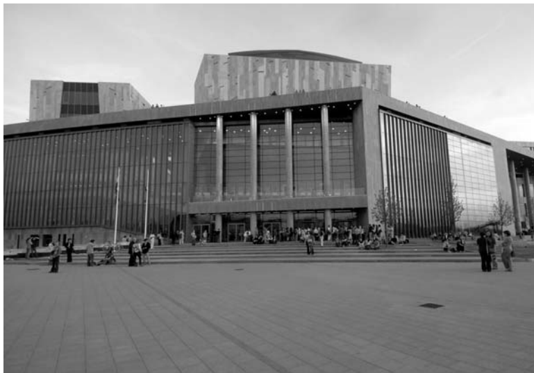
The Palace of Arts in Budapest